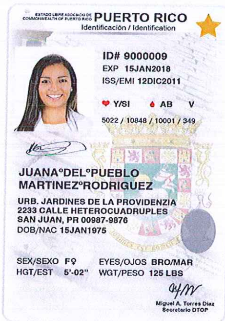
TARJETA DE IDENTIFICACIÓN – REAL ID