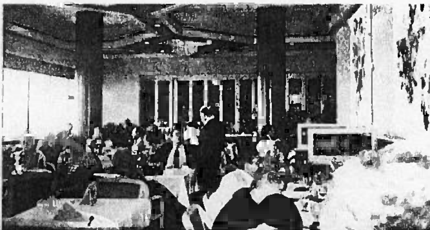
Vista parcial del almuerzo ofrecido después de la Asamblea