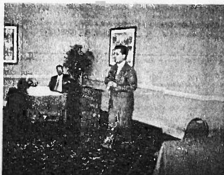
Durante Seminarios de Mediación