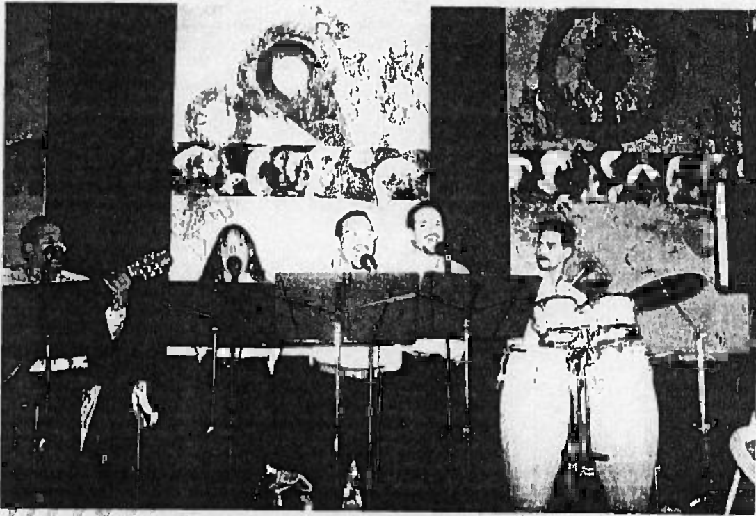
El grupo "ANIMA" ofreció selecciones musicales durante el almuerzo