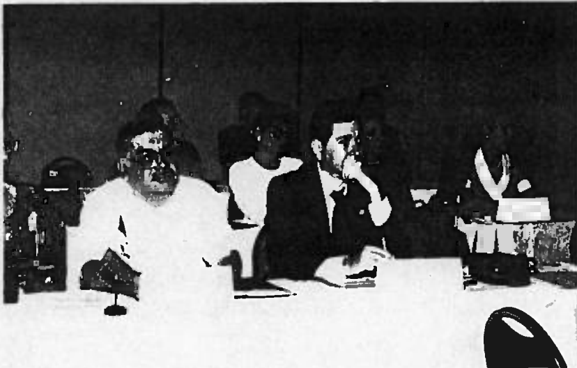
GUATEMALA, HONDURAS, VENEZUELA