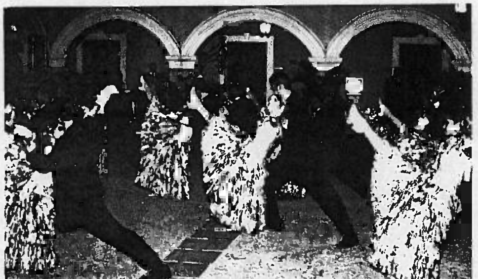
DE LA ACTIVIDAD