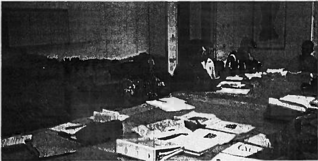
Sesión del Comité Multilateral del Protocolo de Cooperación