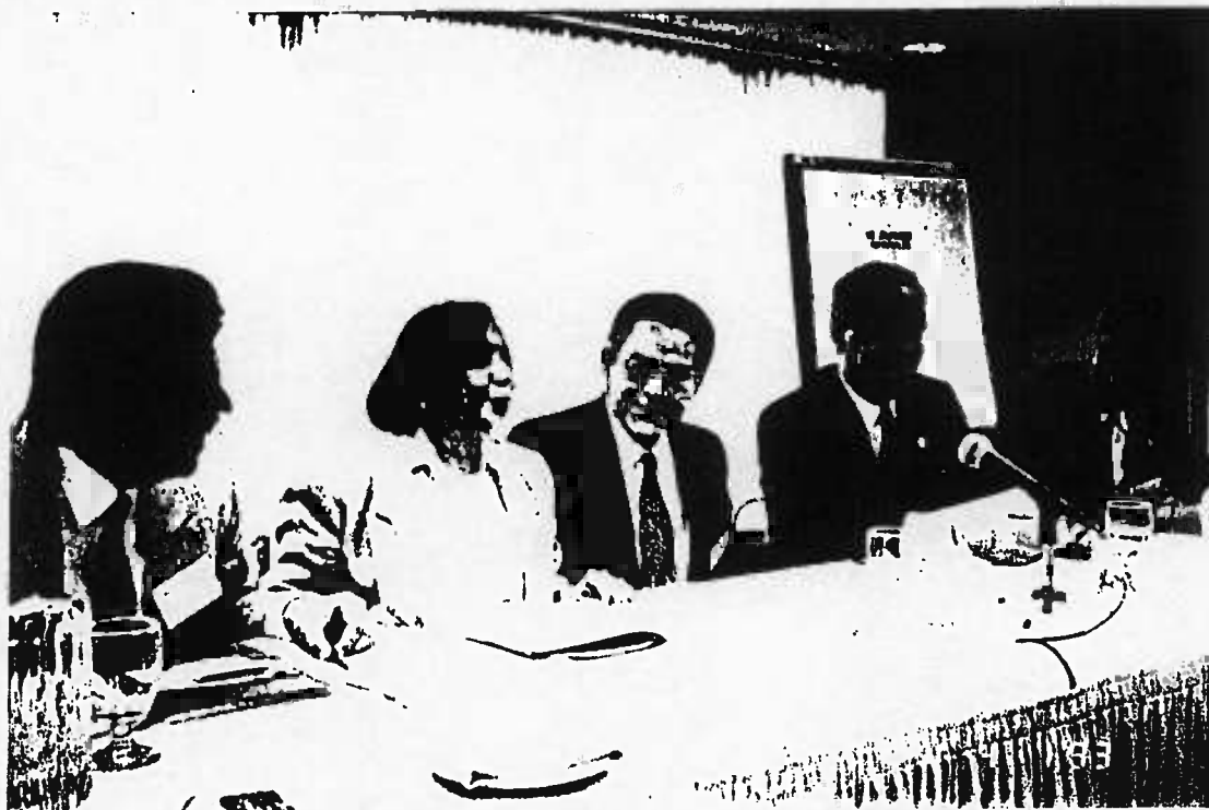
Ceremonia de apertura de la VII Jornada Notarial.

El intercambio cultural y profesional fue de gran provecho para todos los notarios. Agradecemos sinceramente a los compañeros canadienses todas las atenciones que tuvieron para nuestra delegación y les felicitamos por el éxito de la Jornada.