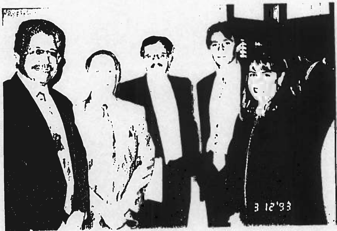
Asistentes al Taller de testamentaria - Humacao, Puerto Rico.

ESTE MODELO ES SOLAMENTE UNA GUIA PARA LA REVISION, ADAPTACION Y APROBACION DEL NOTARIO.