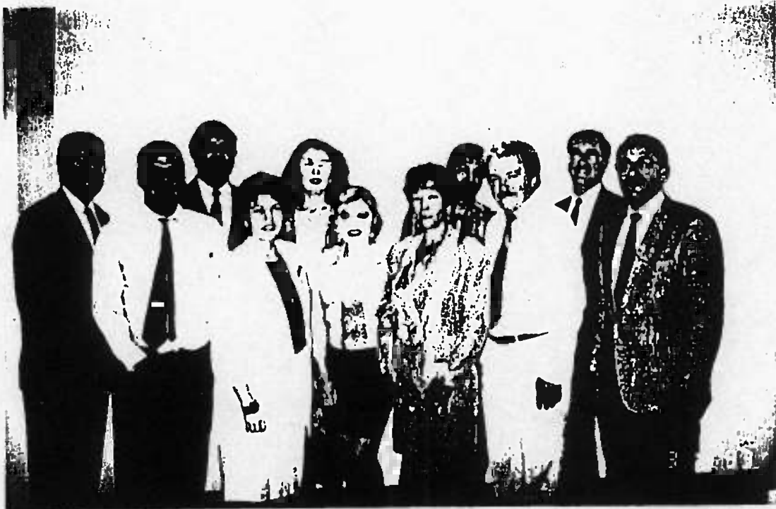
Grupo de notarios que asistieron al taller.