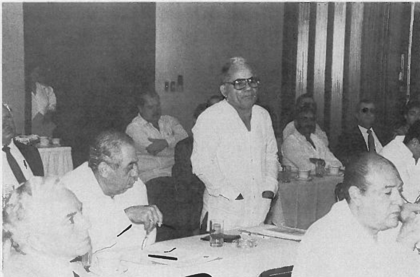
Asistentes a la II Asamblea Anual de la Asociación.