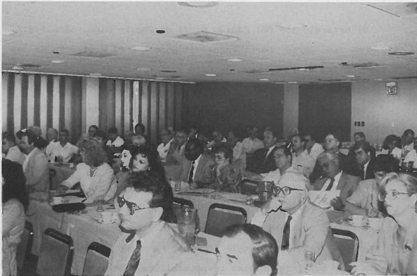
Asistentes a la II Asamblea Anual celebrada el 19 de noviembre en el Bankers Club de San Juan.

Se incluye como Anexo I Escritura de Renuncia de Usultato.