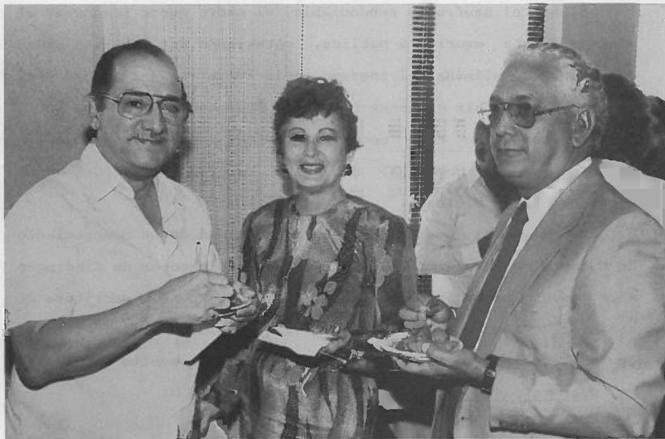
Varios socios disfrutando del acto de confraternización.